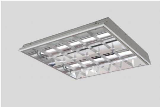
LH001402SRF-M 14W X 2 輕鋼架型