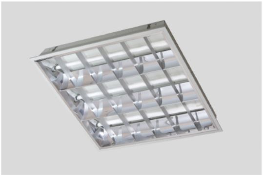
LH001403SRF-M 14W X 3 輕鋼架型