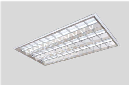
LH002803SRF-M 28W X 3 輕鋼架型